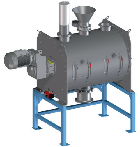
FKM 3000 Basic