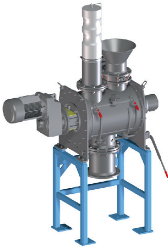
FKM 130 Basic