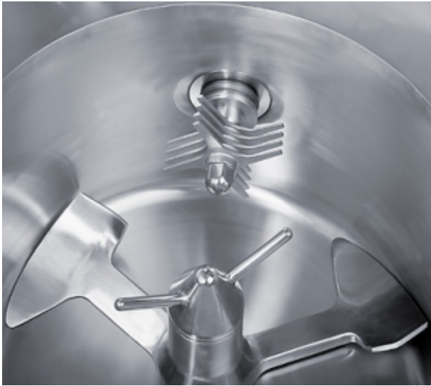
Mischwerkzeug und Messerkopf