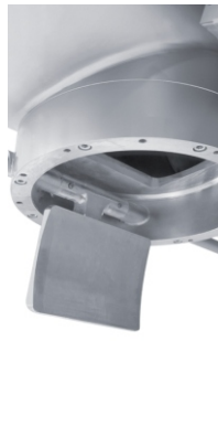
Metallisch dichten- de Entleerklappe