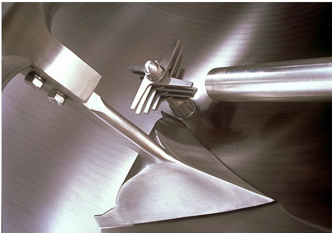
Pflugschar®-Schaufel - Messerkopf - Lanze Flüssigkeitszugabe direkt in den Wirkungsbereich des Messerkopf