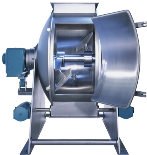
EASY CLEAN 2000 mit geöffneter Inspektionstür