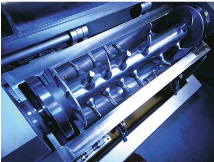
CoriMix® CM Werkzeug für Pharma-Einsatz

Für Mischaufgaben mit intensivem Vormischen und schonendem Nachmischen wird der CoriMix® mit einem kontinuierlichen Pflugschar®-Mischer KM oder einem Mischer Typ TurbuMix® kombiniert.