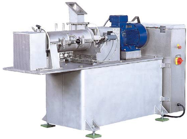
CoriMix® CM 20 in Lebensmittelausführung