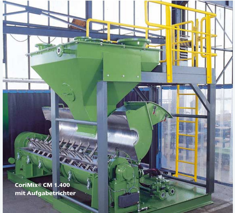
CoriMix® CM 1.400 mit Aufgabetrichter